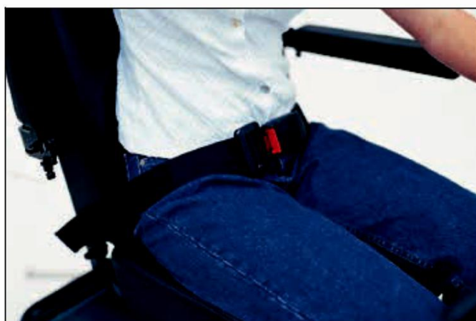
Břišní bezpečnostní pás pro sedadlo Eblo & Ergo 65 až 125 cm T-127-06-144