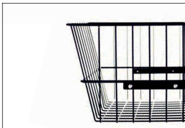
Zadní košík, univerzální - od 34 cm do 70 cm M-127-06-164